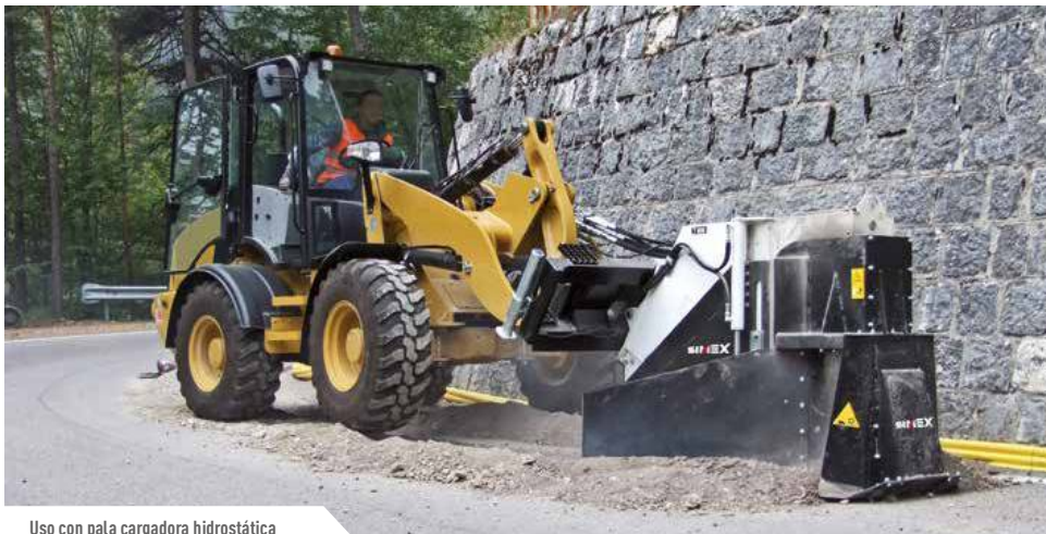
Uso con pala cargadora hidrostática