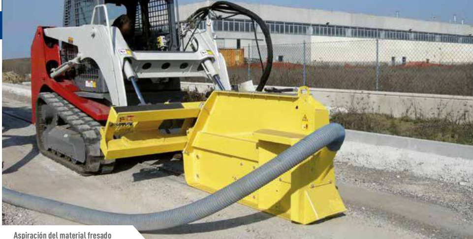
Aspiración del material fresado