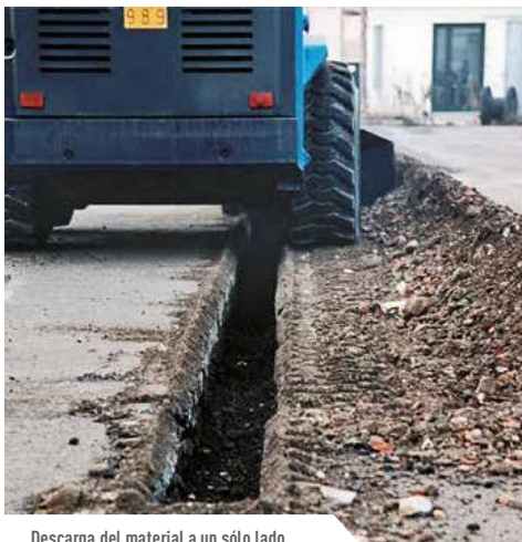
Descarga del material a un sólo lado