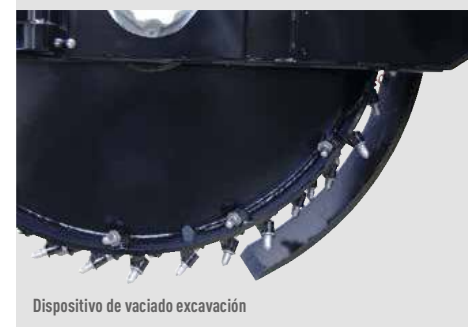
Dispositivo de vaciado excavación