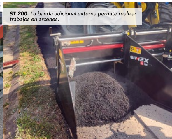
ST 200. La banda adicional externa permite realizar trabajos en arcenes.